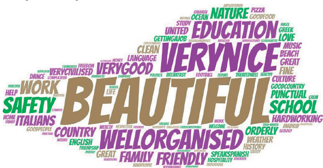
Abbildung 1 - Das erste Wort oder die erste Sache, die einem in den Sinn kommt, wenn man an das Aufnahmeland denkt